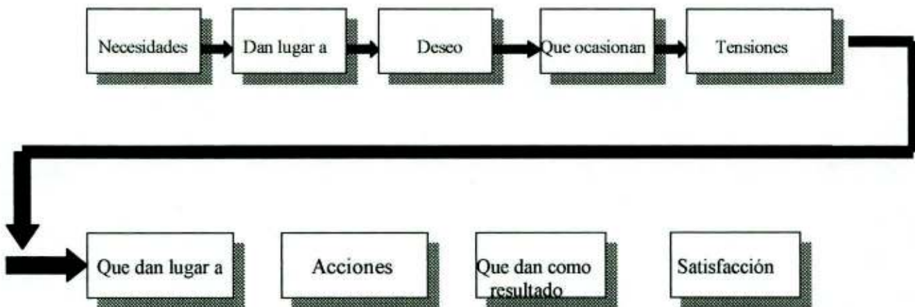
Figura 1. Cadena de necesidades, deseo y satisfacción

Por eso se puede contemplar a la motivación como algo que implica una reacción en cadena: empieza en las necesidades, que se transforman en deseos o metas y que, a su vez, provocan tensiones (es decir, deseos insatisfechos) que después generan acciones para el logro de metas, para así, finalmente, satisfacer los deseos (Figura 1).