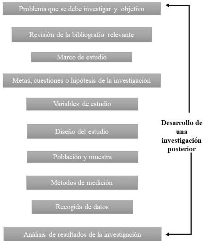
Figura 1. Pasos del proceso de investigación cuantitativa